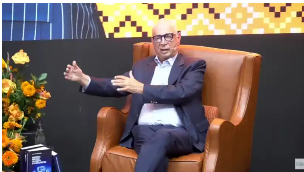
Screenshot van de toespraak van Klaus Schwab aan de Universiteit van Johannesburg op 29 mei 2026, via het YouTube-kanaal van de Schwab Academy

H et intelligente tijdperk vervangt onze cognitieve vaardigheden door AI, en volgens WEF-oprichter Klaus Schwab zouden universiteiten zich moeten richten op het leren van studenten om competent met technologie om te gaan, in plaats van hen louter kennis bij te